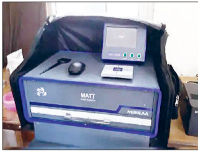
महेन्द्रगढ़। कंप्यूटरीकृत ग्रेन एनालाइजर मशीन।

किसानों को अपने अनाज की गुणवत्ता जांचने के लिए दूसरे जिलों में जाना पड़ता है, जो उनके लिए परेशानी का सबब बना हुआ है। 23 सितंबर से जिले की सभी मंडियों में सरकारी समर्थन मूल्य 2775 रुपये प्रति क्विंटल की दर से बाजरे की खरीद शुरू करने के आदेश सरकार ने दे रखे हैं।