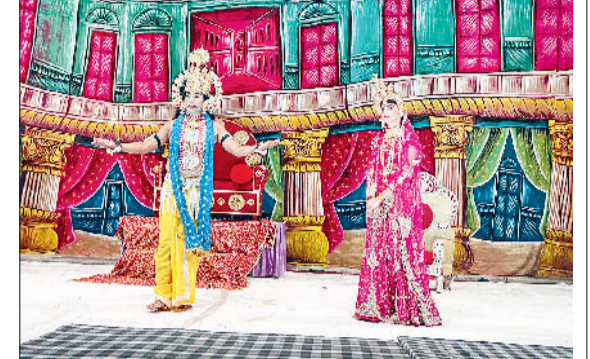
महेन्द्रगढ़। रामलीला का मंचन करते कलाकार।