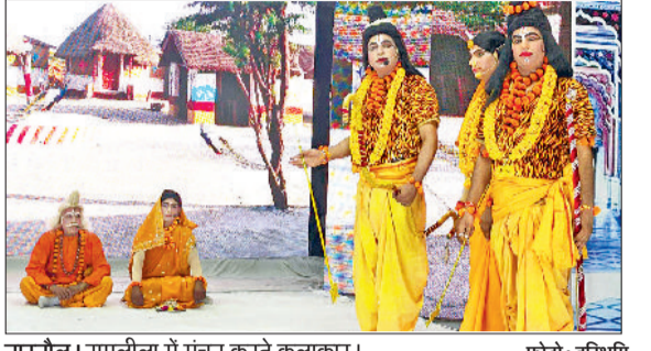
नारनौल। रामलीला में मंचन करते कलाकार।