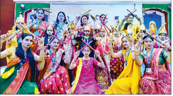
महेन्द्रगढ़। यदुवंशी स्कूल में डांडिया प्रस्तुत करते हुए।

हरिभूमि न्यूज महेन्द्रगढ़ नवरात्रि पर्व के उपलक्ष्य में यदुवंशी स्कूल में शनिवार को विशेष गतिविधियों का आयोजन किया गया। इस अवसर पर विद्यार्थियों ने रंगारंग कार्यक्रम प्रस्तुत किए, जिनमें गरबा, डांडिया नृत्य, भक्ति गीत और सांस्कृतिक प्रस्तुतियां शामिल थीं। पूरे विद्यालय का वातावरण मां दुर्गा की भक्ति और उत्साह से सराबोर रहा। कार्यक्रम में छात्रों ने अपने पारंपरिक परिधानों के साथ सुंदर नृत्य प्रस्तुत कर सबका मन मोह लिया। नवरात्रि के पावन गीतों पर प्रस्तुत की गई सांस्कृतिक झलकियों ने दर्शकों को मंत्रमुग्ध कर दिया। विद्यालय परिवार ने मिलकर मां दुर्गा की आराधना की और सबको