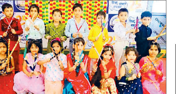
महेन्द्रगढ़। डांडिया नृत्य में भाग लेने वाले बच्चे।