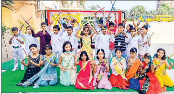
महेन्द्रगढ़। डांडिया नृत्य में भाग लेते हुए।