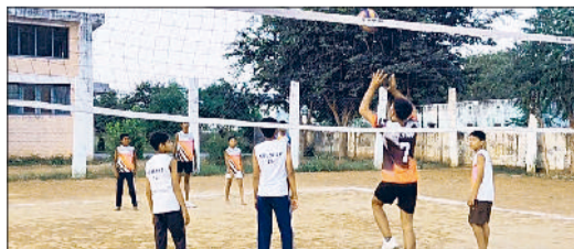
नारनौल। वॉलीबॉल खेलते खिलाड़ी।

खंड नांगल चौधरी के गांव धौलेड़ा में बने राजीव गांधी खेल परिसर हरियाणा के ग्रामीण खेल ढांचे में एक नई पहचान बना रहा है। हाल ही में धौलेड़ा वॉलीबॉल खेल नर्सरी को हरियाणा सरकार के खेल विभाग की ओर से खेल सम्मान पुरस्कार, प्रशस्ति पत्र देकर सम्मानित किया गया है, जो हरियाणा सरकार की खेलों के प्रति प्रतिबद्धता को दर्शाता है। जिला महेन्द्रगढ़ में ग्रामीण अंचल में धौलेड़ा वॉलीबॉल खेल नर्सरी अपनी अलग पहचान बना रही है।