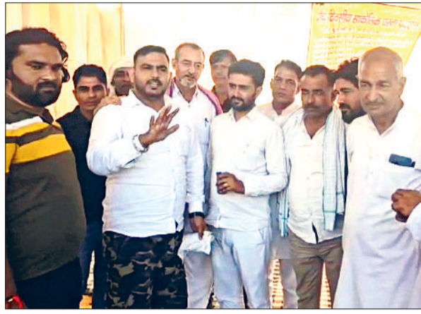
महेन्द्रगढ़। धरने पर विधायक का संदेश बताते हुए।