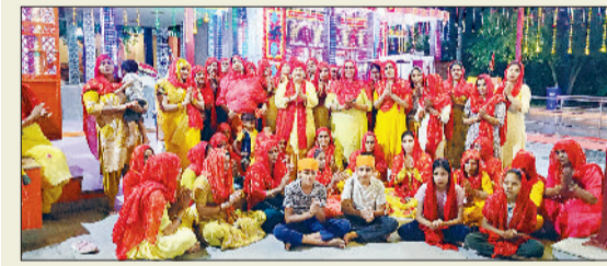
महेन्द्रगढ़। सिसोठ मंदिर पहुंची श्रद्धालु महिलाएं।