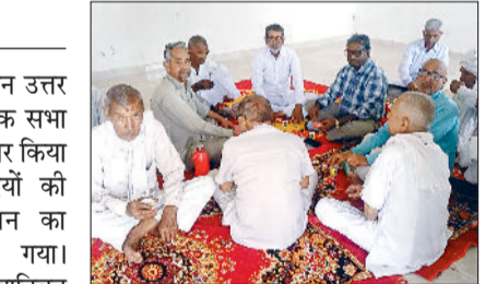
ये रहे मौजूद