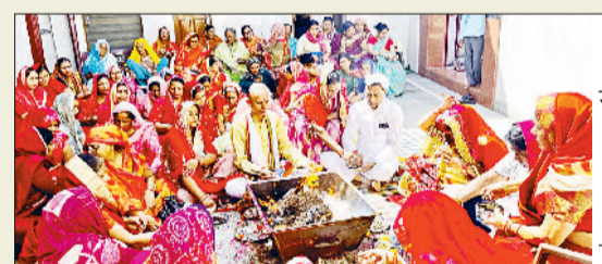
महेन्द्रगढ़। हवन यज्ञ में आहुतियां डालते श्रद्धालु।