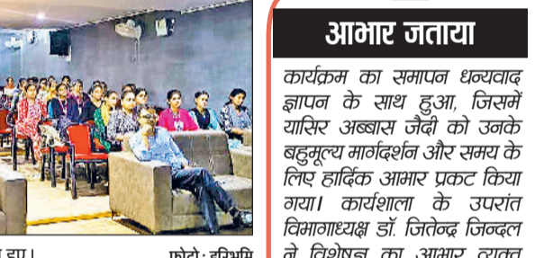
महेन्द्रगढ़। जागरूकता कार्यक्रम में भाग लेते हुए।